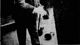
Ο Ι. Μεταξάς τρέχει την χώρα εις κατακρημνισμόν.