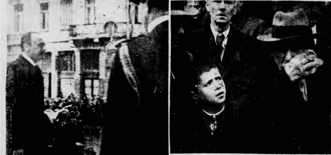
Ο ΛΑΪΚΟΣ ΠΟΝΟΣ ΔΙΑ ΤΗΝ ΑΠΩΛΕΙΑΝ ΤΟΥ ΜΕΓΑΛΟΥ ΑΡΧΗΓΟΥ: Ἄνθρωποι τοῦ λαοῦ, ἄνθρωποι πάσης τάξεως, νέοντες καὶ παλαιοὶ, συνεισώσαντες, δοξάζοντες πρὸς τὸν Μητροπολιτικὸν Ναοὺ διὰ τὴν δόξαν τὸν τελευταίον ἀπολαύσαντες πρὸς τὸν Διευθυντὸν τῆς Νίκης.